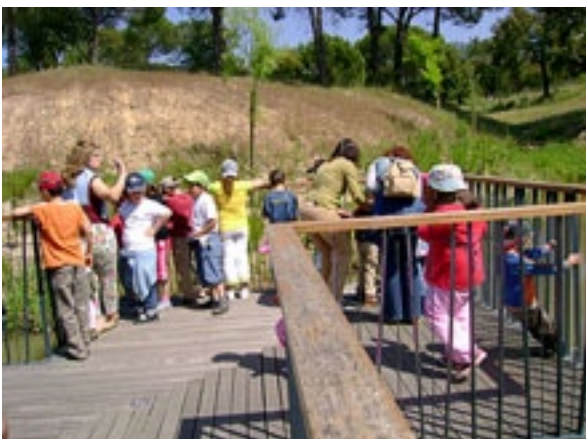
Visita ao Fluvialário