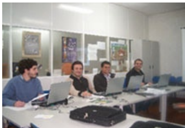
Acções de formação em Flash