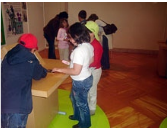
Visita ao Planetário