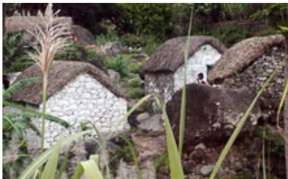
Casas Tradicionais de “Colmo” ainda existentes na Ilha de Santo Antão

gressos conseguidos pelo CRO, na sua execução. Atendendo a que o PLP está a iniciar um novo período de programação, com características mais imateriais em termos de intervenção, foram identificadas as áreas a trabalhar, no sentido de reforçar a equipa do CRP e das Associações Comunitárias de Desenvolvimento de Santo Antão, dos conhecimentos necessários aos desafios para o desenvolvimento da sua ilha.