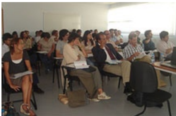
Seminário “Desenvolvimento Rural: Resultados e Novas Oportunidades”

Em Junho de 2008 vai realizar-se na Polónia a Universidade Rural Europeia (U.R.E.), aqui vai ser apresentado o itinerário com as acções desenvolvidas no âmbito do projecto “Mais Além”.