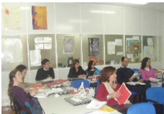
Formação sobre Responsabilidade Social