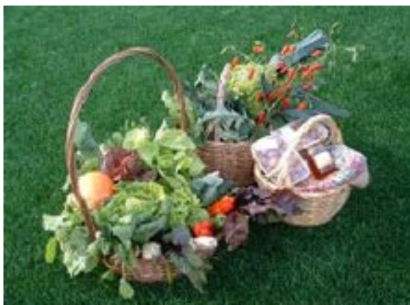
Cabazes de produtores já integrados na rede de comercialização PROVE

O Monte assume o papel de entidade incorporadora do produto, no sentido em que o entende como uma boa prática a implementar, com vista a mobilizar a criação de uma rede de comercialização dos produtos de “quinta” (pequenos produtores) da sua zona de intervenção. O projecto irá decorrer durante o ano de 2008.