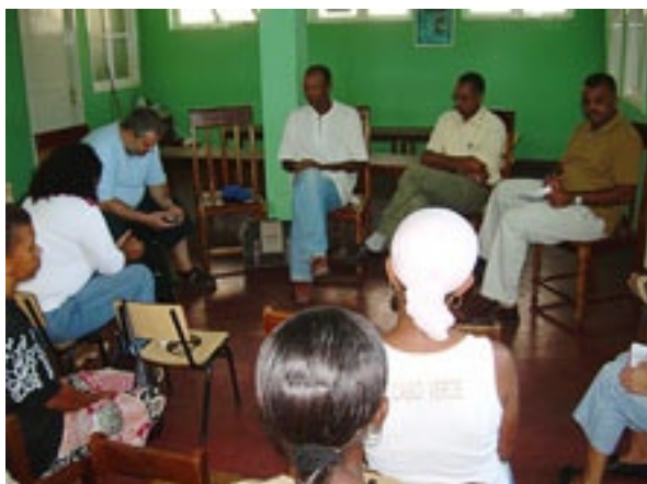
Reunião com a Associação Comunitária de Desenvolvimento de Lagedos - Porto Novo, Santo Antão

Esta 3ª missão de assistência técnica incidiu na Ilha de Santo Antão, tendo o Monte articulado trabalho com o Concelho Regional de Parceiros (CRP) desta ilha, que é o promotor do Projecto Local de Luta contra a Pobreza. Realizou-se um balanço da implementação do Programa de Luta contra a Pobreza (PLP) na Ilha de Santo Antão tendo sido evidenciadas as dificuldades sentidas bem como os pro-