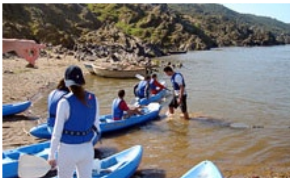
Passeio de Canoagem, Mértola