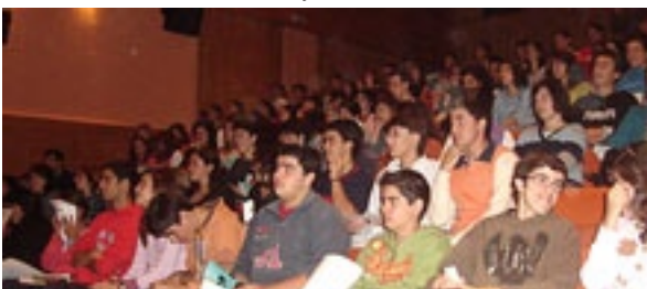
Sessão de Esclarecimento Associativismo